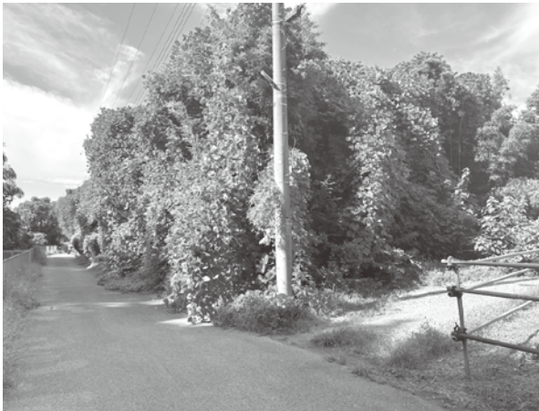
現況の石神西立野特定区画整理事業6号遊水池建設現場

今年度は、台風第2号により冠水した石神西立野特定土地区画整理事業地区内の県道吉場安行東京線の冠水対策として、一部確保できている用地に調整池を先行して整備します。こうした部分的な整備が連鎖的に結びつき、結果的には事業の早期完了に繋がることから、地域の状況に応じた整備をしていきます。