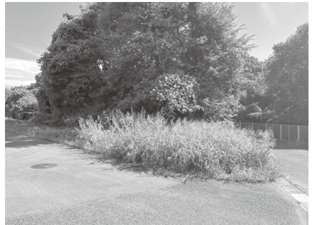
現況の石神西立野特定区画整理事業6号遊水池建設現場